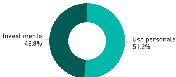
Motivo acquisto box - Italia II semestre 2019

L’analisi delle informazioni raccolte presso le agenzie affiliate Tecnocasa e Tecnorete mostra che il 67,9% delle operazioni che hanno interessato i box hanno avuto come finalità l’acquisto , mentre il 32,1% sono operazioni di locazione.